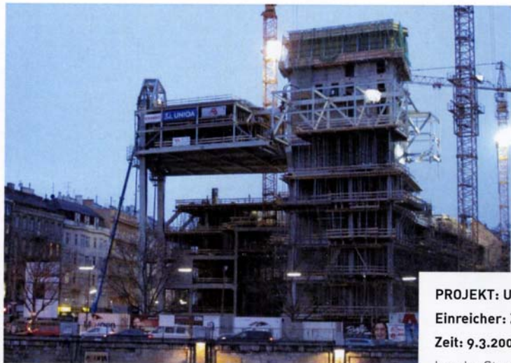
PROJEKT: UNIQA HOCHHAUS WIEN Einreicher: Zeman & Co GmbH, Wien Zeit: 9.3.2008

In zehn Stunden wurden zwei fertige Stockwerke mit 1600 Tonnen Gewicht in 30 Meter Höhe gehoben.